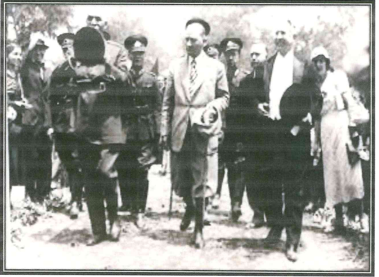
Atatürk'ün Foça'ya Gelişi-09.04.1934-

“Millî emeller, millî irade yalnız bir şahsın düşünmesinden değil bütün millet fertlerinin arzularının, emellerinin bileşkesinden ibarettir.”